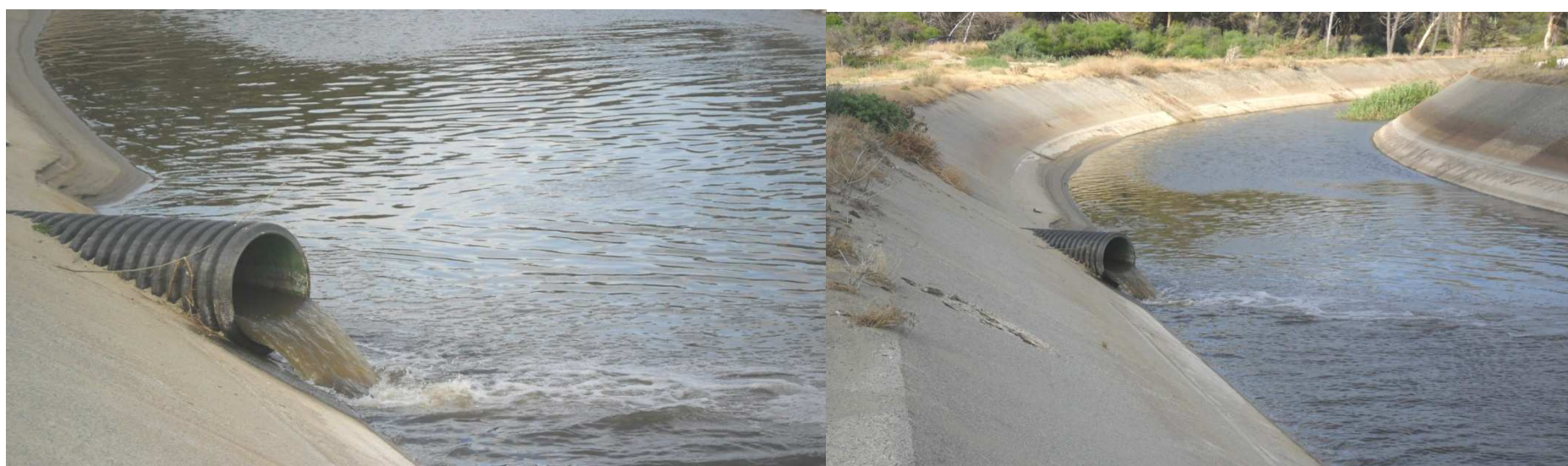
MARINA DI CURINGA