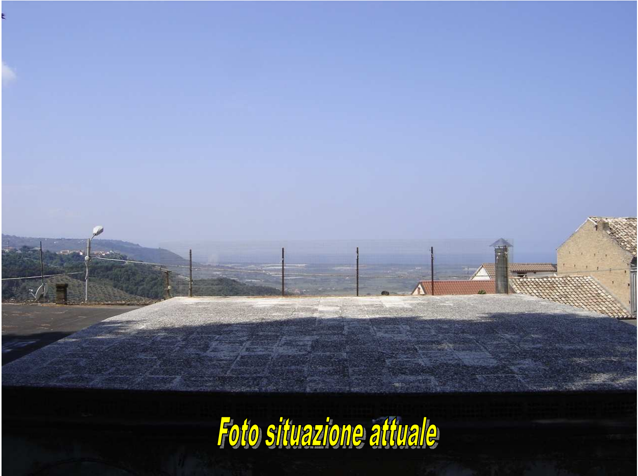
Foto situazione attuale