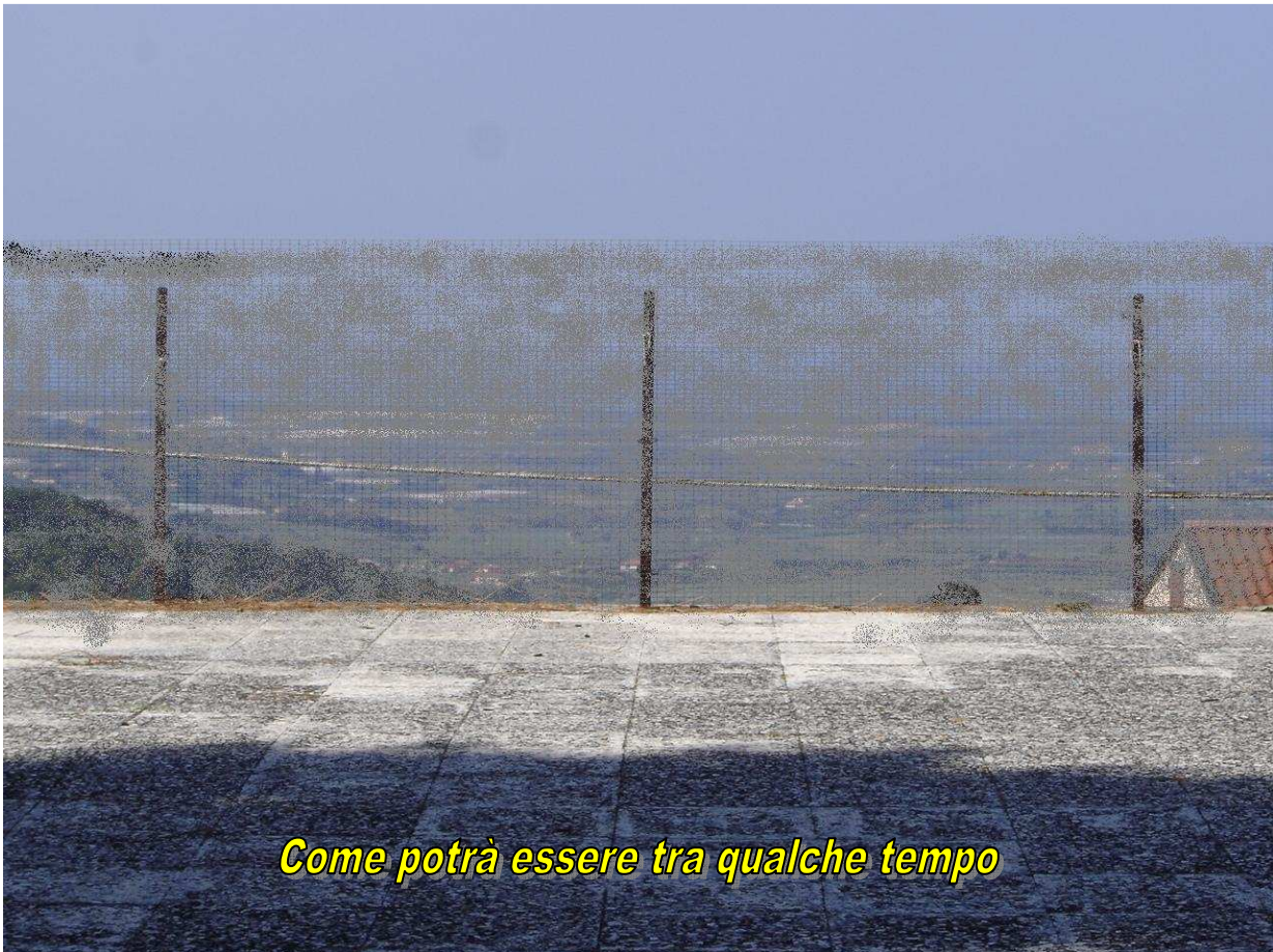
Come potrà essere tra qualche tempo