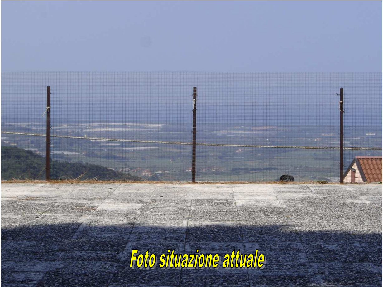
Foto situazione attuale