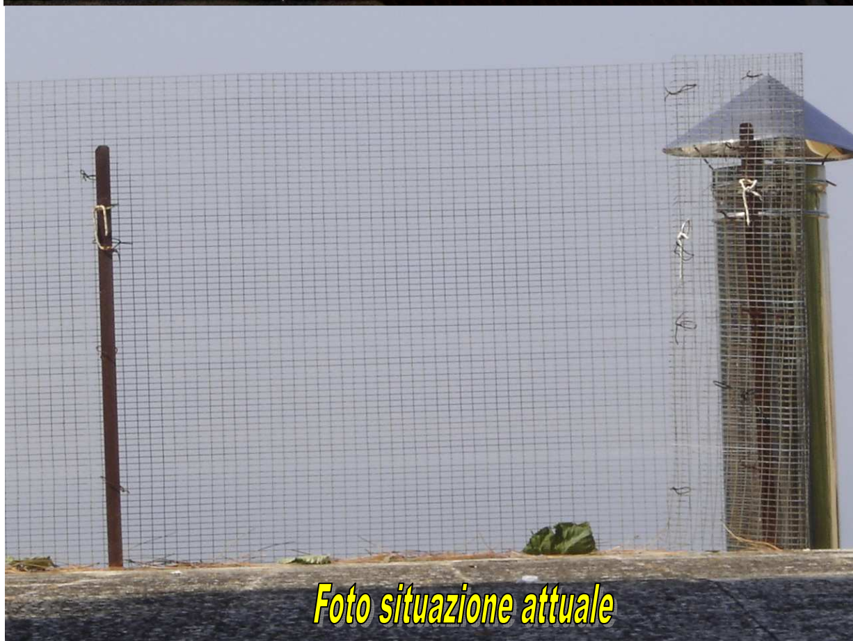
Foto situazione attuale