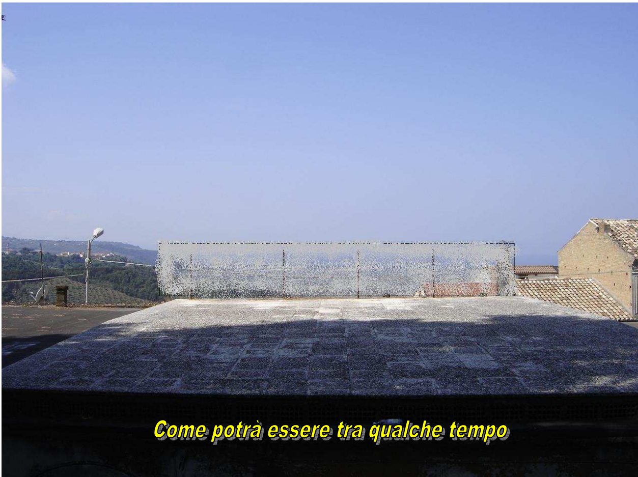
Come potrà essere tra qualche tempo