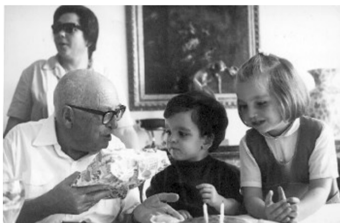
Pietro Nenni con i nipoti