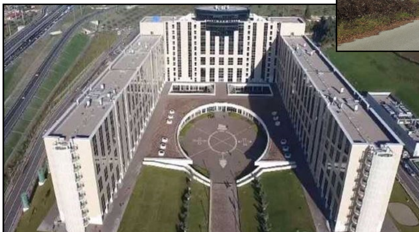
A lato: "Palazzo degli Itali" a Germaneto di Catanzaro, sede della Regione Calabria, opera del famoso architetto Paolo Portoghesi, è molto vicino ai sentieri interessati dal cammino della Prima Italia. Il nome fu scelto a grande maggioranza nel 2015 da un sondaggio promosso dal Comune di Catanzaro.