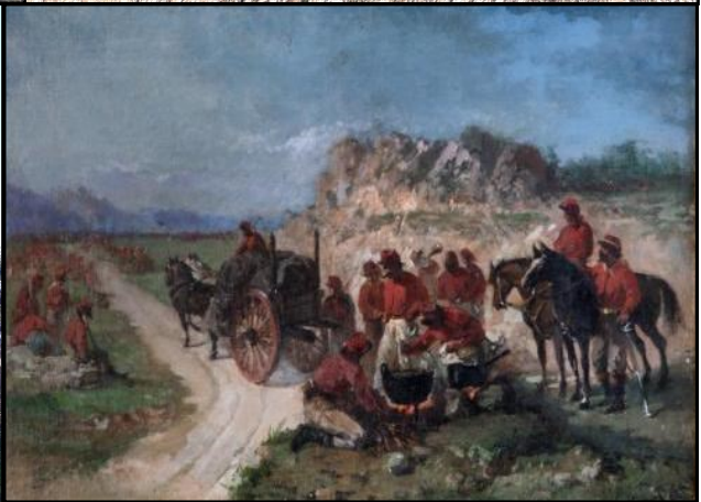
"Il bivacco di Garibaldi", celebre opera del pittore patriota Andrea Cefaly da Cortale (XIX sec., olio su tela, Museo Marca di Catanzaro)