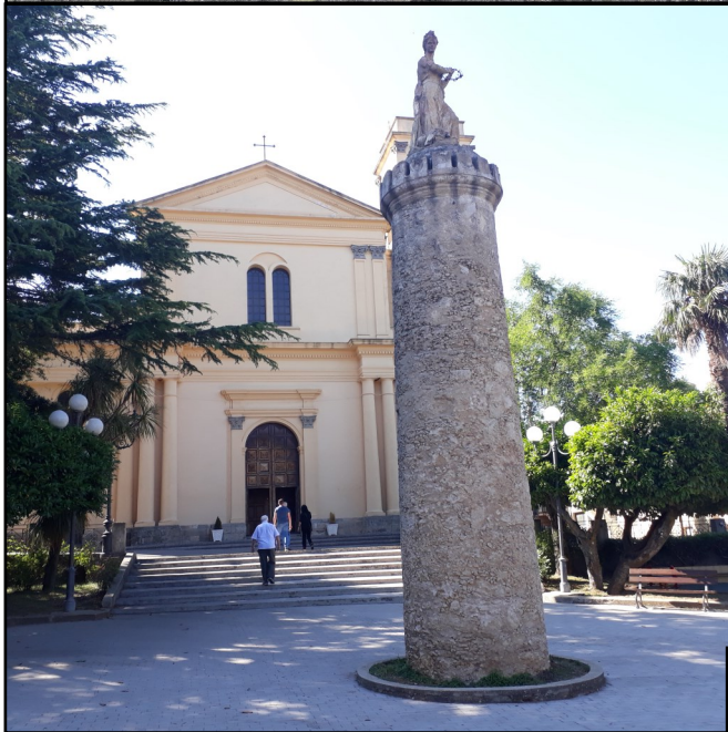
Sopra: piazza Italia a Curinga, con l'unica scultura documentata di Andrea Cefaly, che raffigura l'Italia come una donna che stringe in mano una corona fiorita; da qui il nome dialettale con cui è nota l'opera: "donnahjuri".