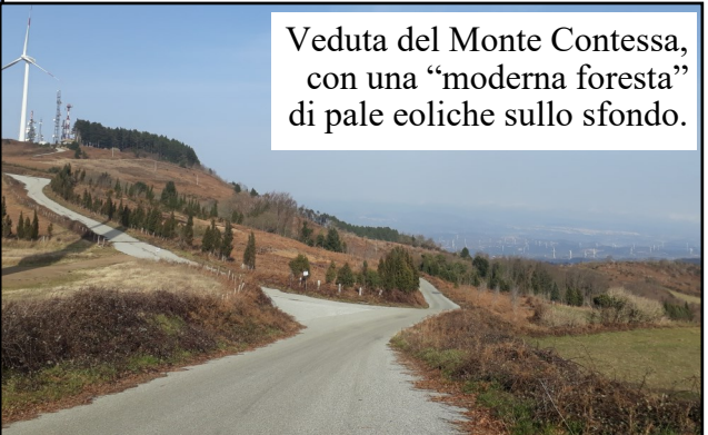
Veduta del Monte Contessa, con una "moderna foresta" di pale eoliche sullo sfondo.