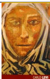
CARLO LEVI C. Levi