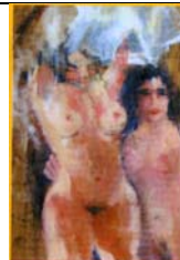
LORENZO ALBINO Albino