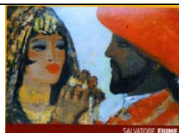
SALVATORE FIUME Fiume