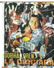
MIMMO ROTELLA Rotella